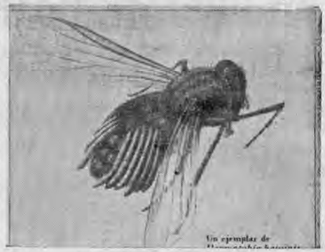
Un ejemplar de Dermatobia hominis

dan exterminadas también las larvas en los buzones del costado derecho, es decir del lado sin tratar.