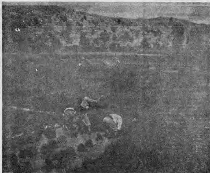
Esta foto enseña arroceros en un arrozal de la provincia de Valencia, España, una de las regiones principales en este cultivo. Con más de 6100 kg/ha, figura entre un rendimiento medio por hectárea que es el más grande del mundo

En el curso de los últimos cien años, el arroz llegó a ser uno de los productos alimenticios más importantes, cuando no al primordial del mundo. Apenas hay otra planta que es objeto de tantas leyendas y ceremonias culturales. El pábulo de los países de monzón, que alimenta en la actualidad a más de la mitad de la humanidad, es designado por los pueblos de estas zonas como el alimento más delicioso de los dioses. En agradecimiento de ello, año por año se viene ofreciendo sobre un sinúmero de altares lo mejor de las cosechas como ofrenda.